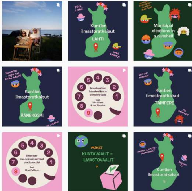
KUVA: Kuntien ilmastoratkaisut -julkaisujen kansikuvia, Climate Moven Instagram-tili.

Kuntavaaleihin liittyvien faktojen jakamisen lisäksi innostusta ja uskoa rakenteelliseen muutokseen valettiin nostamalla inspiroivia tapauksia kuntien jo toteuttamista ilmastoratkaisuista.