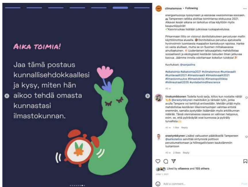
KUVA: Kuntavaalikampanjan viestinnällinen tavoite oli kannustaa myös vaikuttamaan kansalaisaktiivisuuteen oman kunnan edustajia kohtaan. Climate Moven Instagram.