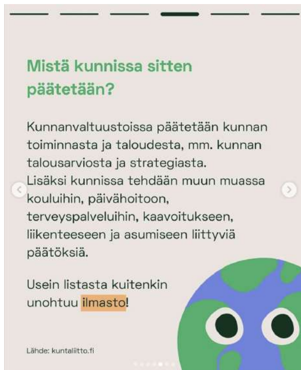
KUVAT: Climate Moven Instagram-tili, kampanjan lanseeraus